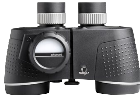
NOBLEX® NF 7 x 50 C advanced

Solche Möglichkeiten gibt es bei einem Kompassfernglas nicht, aus dem einfachen Grund, weil sie mobil sind und dass sie umgebende Magnetfeld sich ständig ändert. Heißt, die Peilung eines Kompassfernglases muss im Grunde immer als eigenständiger Wert betrachtet werden, der sich nur bedingt mit den Werten anderer Kompassse vergleichen lässt.