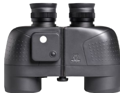
NOBLEX® NF 7 x 50 C inception